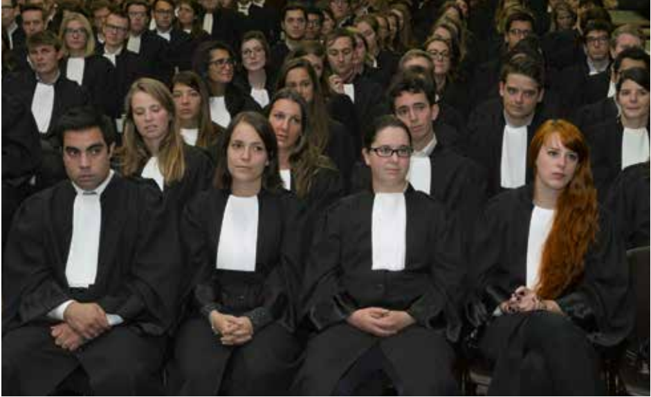
Advocaat-stagiairs tijdens de eedaflegging in oktober 2016

uniform van de Middeleeuwse clerus. Aan de vroegere soutanes van de Middeleeuwse clerus zat immers vaak een kap. Met de jaren behoudt het uniform van advocaten deze kap.