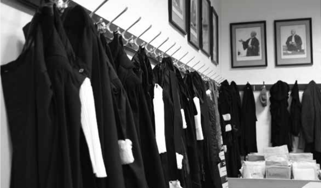
Advocatentogas in de vestiaire van het Justitiepaleis te Brussel

gilden hun onderscheiden kledij hadden, hadden de advocaten hun toga. Daar dit een teken was van hun stand, droegen zij deze toga overal. 4 Thuis en op straat, op bezoek bij vrienden, overal paradeerden zij 'als pauwen' in hun toga's.