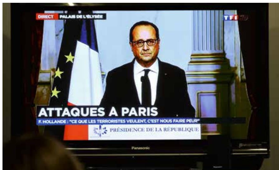
Na een reeks aanslagen in de Franse hoofdstad, riep president Hollande op 13 november 2015 de noodtoestand uit. Die werd ondertussen al meermaals verlengd en is nog steeds een feit.

Er is ook geen enkele aanwijzing dat de vele extra maatregelen die van kracht zouden kunnen worden in het kader van een noodtoestand, ook maar één aanslag hadden kunnen verhinderen. Het komt ook bijzonder vreemd over dat dezelfde politici die constant zitten te besparen op de werking van justitie, plots vaststellen dat justitie in oude gebouwen werkt en onderbemand is. In plaats van meer middelen te voorzien voor justitie, wordt (weer eens) een nieuwe wet voorgesteld en wordt het witte konijn 'noodtoestand' uit de politieke hoed getoverd.