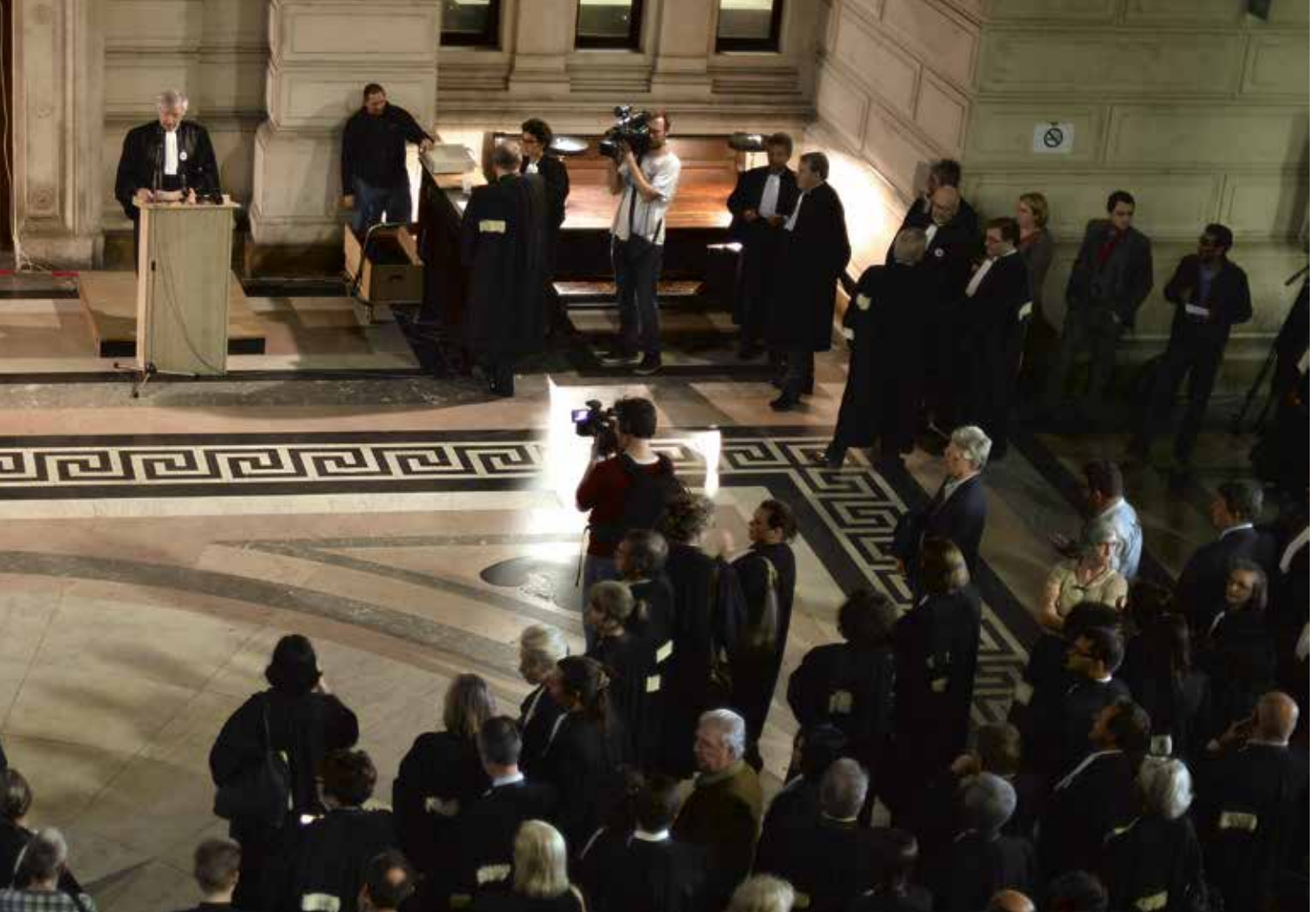
Op 7 juni 2016 voerden de magistraten actie tegen de besparingen op Justitie.

2% op werkingskosten en investeringen per jaar. Besparen werd in de ogen van de beleidsmakers belangrijker dan de goede dienstverlening.