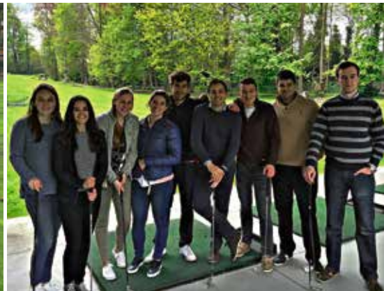
De JABkes staan vooral bekend voor hun gezellige afterworks, de onvergetelijke Nacht van de Stagiairs / Nuit des Stagiairs, de Baliequiz en tal van culturele- en sportactiviteiten.

Echter, wordt maar al te vaak vergeten dat JABkes ook een 'Serious' kant heeft. Zo organiseert JABkes, in samenwerking met de NOAB, het leerrijke project 'De Zitting'. Hierbij kan een stagiair een zitting volgen aan de zijde van de rechter. Een unieke kans. Verder zet JABkes ook in op een aantal praktische opleidingen die de stagiair persoonlijk kan interesseren zoals "welke beroepskosten kan ik aftrekken?" of "wanneer richt ik best een BVBA op?".