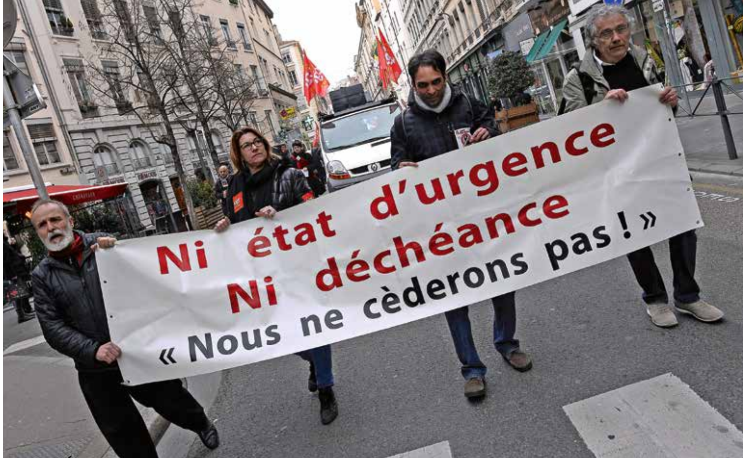
Ondanks regelmatig protest blijft de noodtoestand in Frankrijk gehandhaafd.