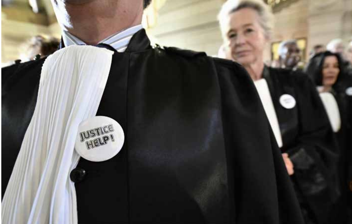
Heel wat magistraten toonden op 7 juni hun ongenoegen maar gingen na de protestactie meteen terug aan het werk.

Deze oproep richtte zich tot alle beleidsverantwoordelijken van het land: regering, parlement, politieke partijen, minister van Justitie, minister van Begroting, enz. Studies wijzen uit dat de burger weinig vertrouwen heeft in justitie. Nochtans is justitie een van de hoogste waarden in een democratische samenleving omdat conflicten niet door partijen worden uitgevochten, maar aan een onafhankelijke en onpartijdige instantie worden toevertrouwd.