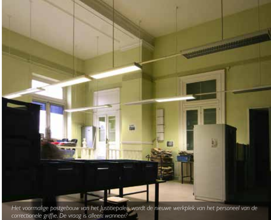
Het voormalige postgebouw van het Justitiepaleis wordt de nieuwe werkplek van het personeel van de correctionele griffie. De vraag is alleen: wanneer?

Dit is een zeer accuut probleem waar wij bij de Nederlandstalige rechtbank veel aandacht voor hebben, maar waarin wij niet gevolgd worden door de FOD Justitie. Ondertussen hebben wij bepaalde diensten moeten stilleggen wegens gebrek aan personeel, bijvoorbeeld de scandienst die was opgericht met het oog op de digitalisering van de strafdossiers.