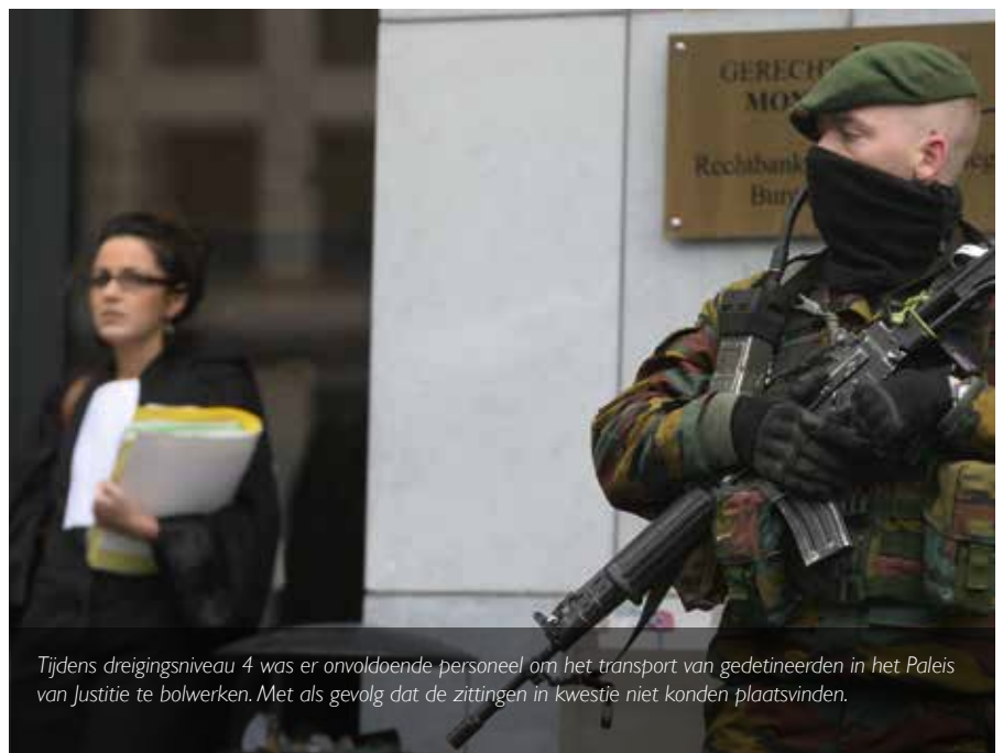
Tijdens dreigingsniveau 4 was er onvoldoende personeel om het transport van gedetineerden in het Paleis van Justitie te bolwerken. Met als gevolg dat de zittingen in kwestie niet konden plaatsvinden.

Dit is problematisch, want als wij nu achterstand creëren, wordt het bijzonder moeilijk om dit later opnieuw in te halen. Onze werklast stijgt immers continu. Vooral in correctionele zaken is de werklast sinds de oprichting van het parket Halle-Vilvoorde gestegen. De familierechtbank draait ondertussen ook op volle toeren en is zeer arbeidsintensief. Bovendien krijgt ook de strafuitvoeringsrechtbank er de materie van geïnterneerden bij. Op een gegeven moment zullen wij op een punt komen waarop wij geen extra zittingen meer kunnen organiseren omdat er gewoon geen personeel is om deze zittingen te laten plaatsvinden. Nochtans zijn wij een openbare dienstverlening en heeft de burger recht op deze zittingen.